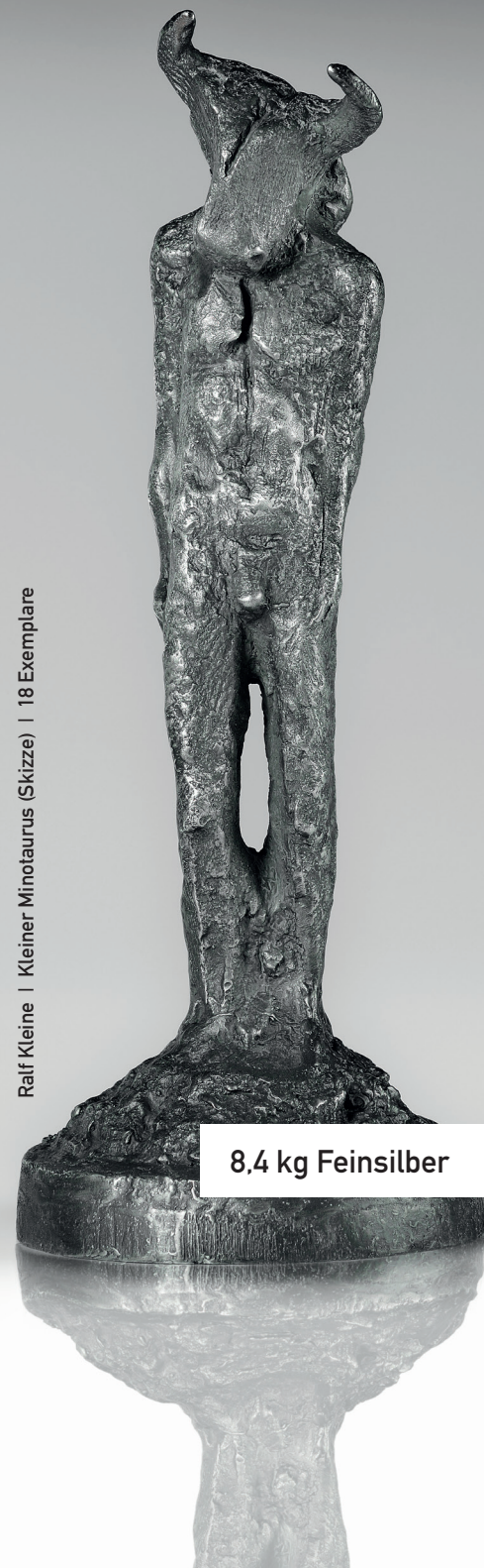
Ralf Kleine | Kleiner Minotaurus (Skizze) | 18 Exemplare

Aber in jeder Krise gibt es eben auch Gewinner. Das chinesische Schriftzeichen für Krise und Chance ist dasselbe. Es sind diejenigen, die sich ihr eigenständiges Denken bewahrt haben und Eigenverantwortung für alle Lebensbereiche übernehmen. Um als Gewinner gestärkt aus dieser Krise herauszugehen, sind nur einige ganz einfache und leicht umsetzbare Vermögensschutzmaßnahmen erforderlich, die wir Ihnen in Kasten 3 vorstellen. ■